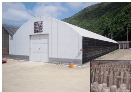
버섯 재배 시설